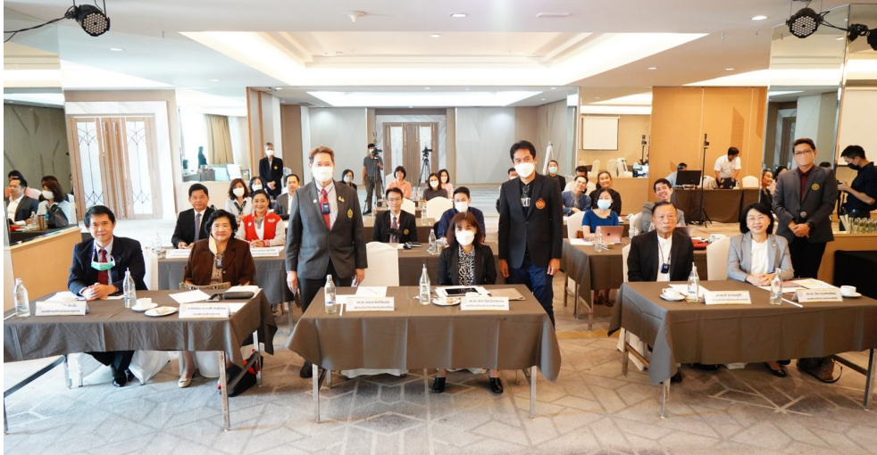
คณะผู้บริหารมหาวิทยาลัย (อธิการบดี รองอธิการบดี และผู้ช่วยอธิการบดี) และคณะทำงานขับเคลื่อนแผนยุทธศาสตร์ เข้าร่วมประชุม