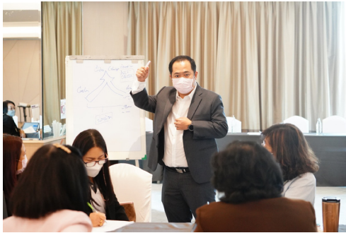
ยุทธศาสตร์ที่ 1 การเป็นผู้นำทางการศึกษา (Educational Leader)