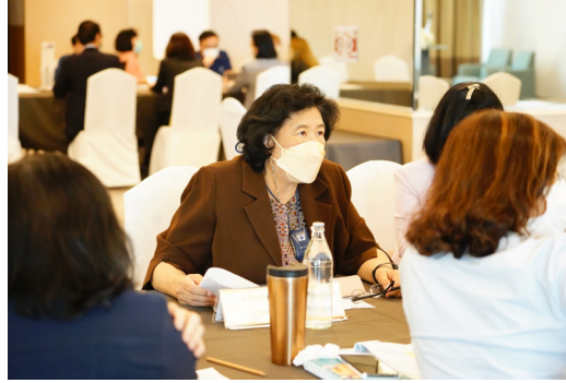
ยุทธศาสตร์ที่ 1 การเป็นผู้นำทางการศึกษา (Educational Leader)