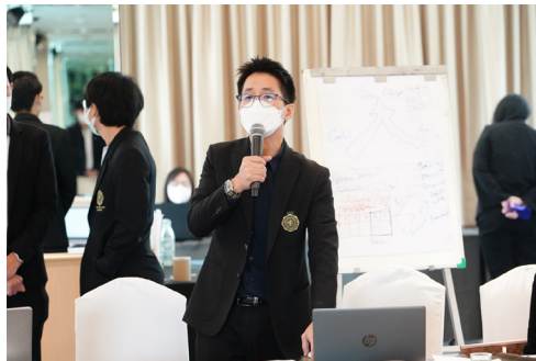
ยุทธศาสตร์ที่ 3 พันธกิจสัมพันธ์เพื่อสังคม (Social Engagement)