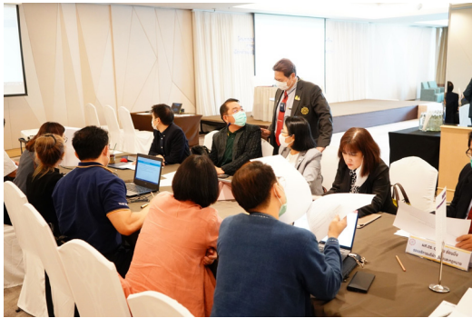
ยุทธศาสตร์ที่ 2 การเป็นองค์กรที่มีสมรรถนะสูงและมีธรรมาภิบาล (High Performance and Good Governance Organization)