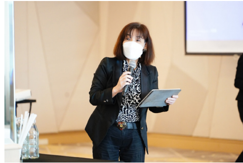
ยุทธศาสตร์ที่ 2 การเป็นองค์กรที่มีสมรรถนะสูงและมีธรรมาภิบาล (High Performance and Good Governance Organization)