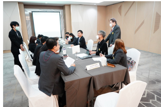
ยุทธศาสตร์ที่ 3 พันธกิจสัมพันธ์เพื่อสังคม (Social Engagement)